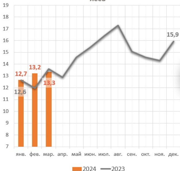
Помесячная динамика выдач денежных средств, млрд леев