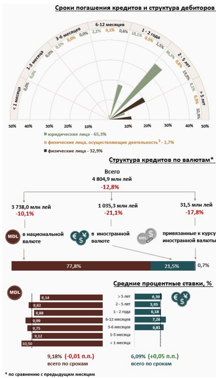
Инфографика 1. Динамика вновь выданных кредитов 2

С точки зрения сроков выданных кредитов, наибольшим спросом пользовались кредиты на срок от 2 до 5 лет, доля которых составила 57,0% от общего объема выданных кредитов. Объем данных кредитов, выданных юридическим лицам, составил 36,3% от общего объема кредитов.