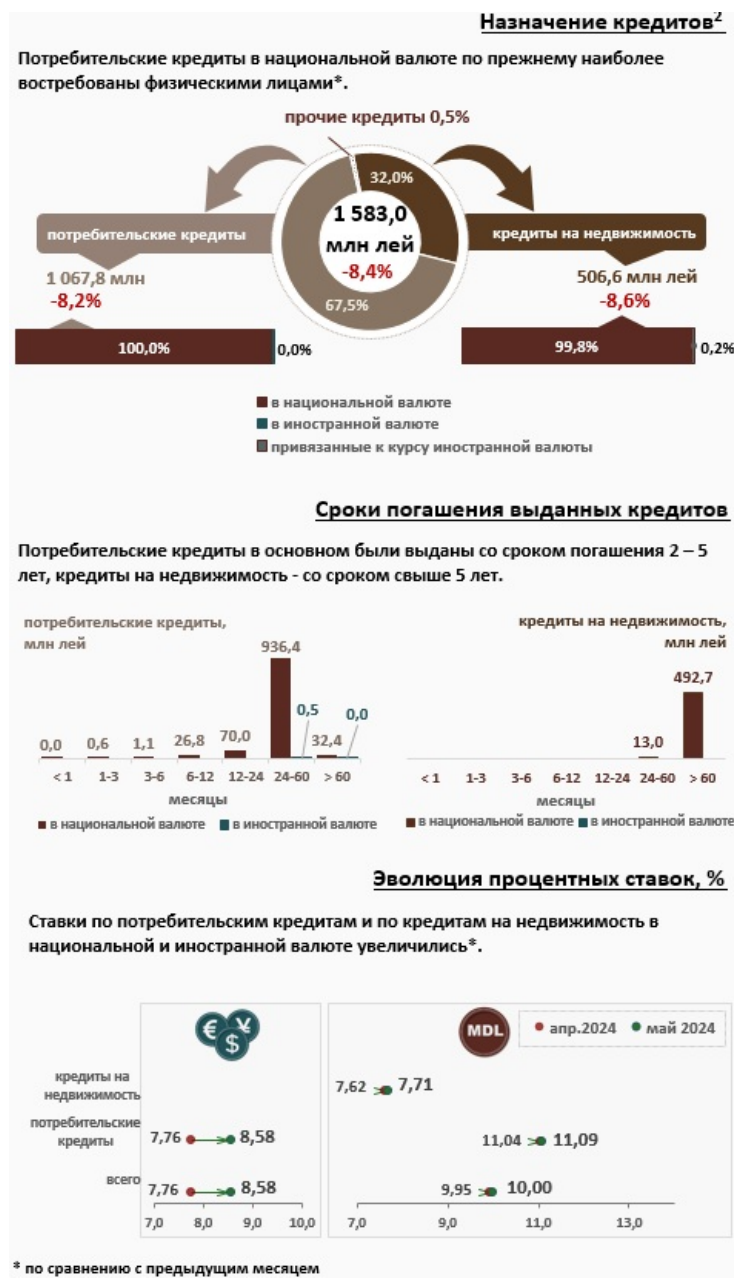
Инфографика 2. Вновь выданные кредиты физическим лицам 3

Кредиты на недвижимость составляют 32,0% от всех кредитов, выданных физическим лицам, и были представлены в основном в национальной валюте (99,8% от общего объема кредитов на недвижимость).