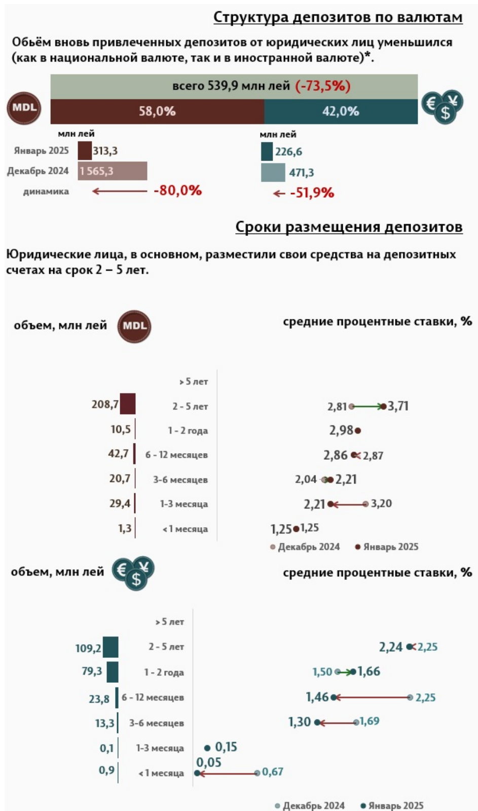
Инфографика 3. Вновь привлечённые срочные депозиты от юридических лиц

Средняя ставка по депозитам, привлечённым в национальной валюте от юридических лиц, по сравнению с предыдущим месяцем повысилась на 0,49 п.п., до уровня 3,32%, а средняя ставка по депозитам, привлечённым