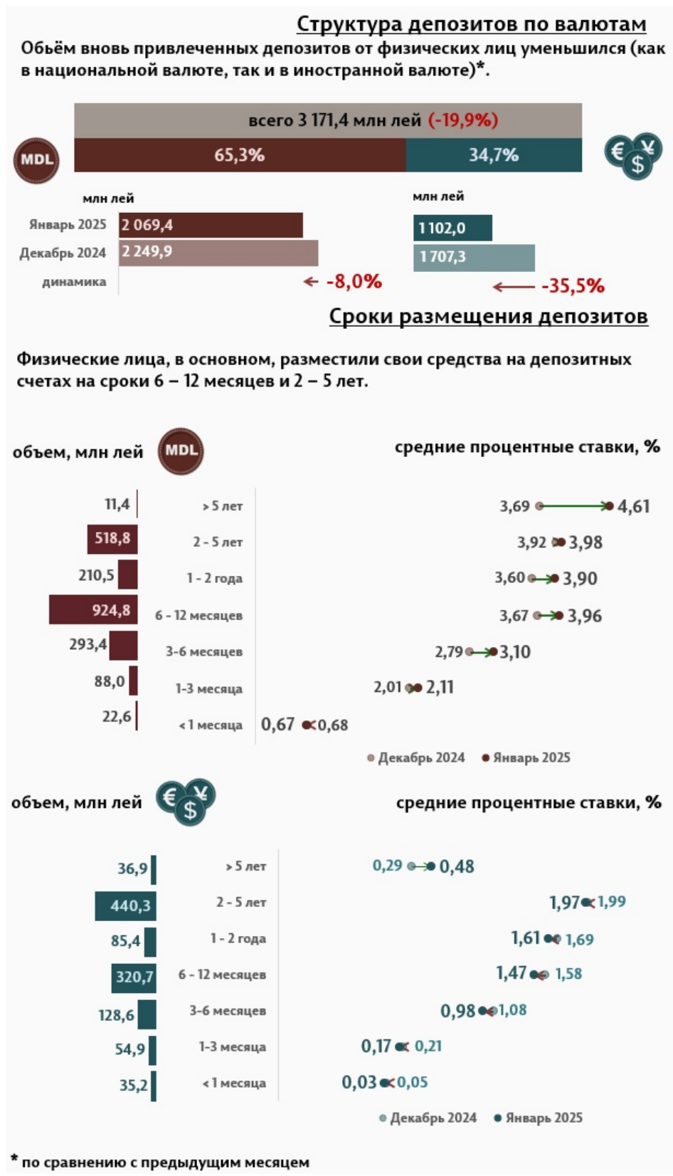
Инфографика 2. Вновь привлечённые срочные депозиты от физических лиц

6 до 12 месяцев, доля которых составила 39,3% и депозиты со сроком от 2 до 5 лет с долей 30,2% от общего объёма депозитов физических лиц. По сравнению с январём 2024 г., объём вновь привлечённых депозитов от физических лиц в национальной валюте, уменьшился на 20,5%, а в иностранной валюте увеличился на 15,6%.