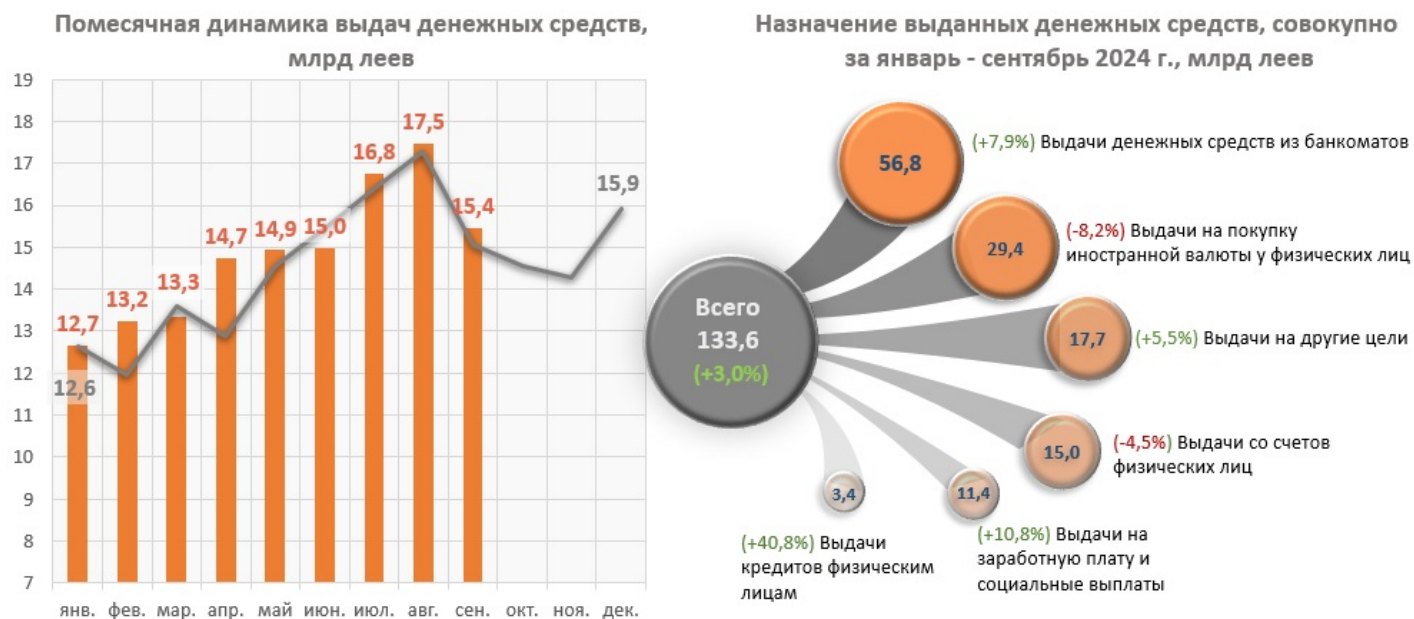
Диаграмма № 2. Основные цели выдачи денежной наличности из касс банков и их ежемесячная динамика 5

845,2 млн леев (+3,0%) по сравнению с тем же периодом прошлого года и составил 133 592,7 млн леев (Диаграмма № 2).