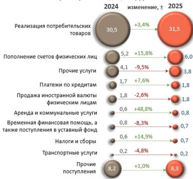
Основные источники денежных поступлений, совокупно за январь-апрель 2025 г., млрд леев