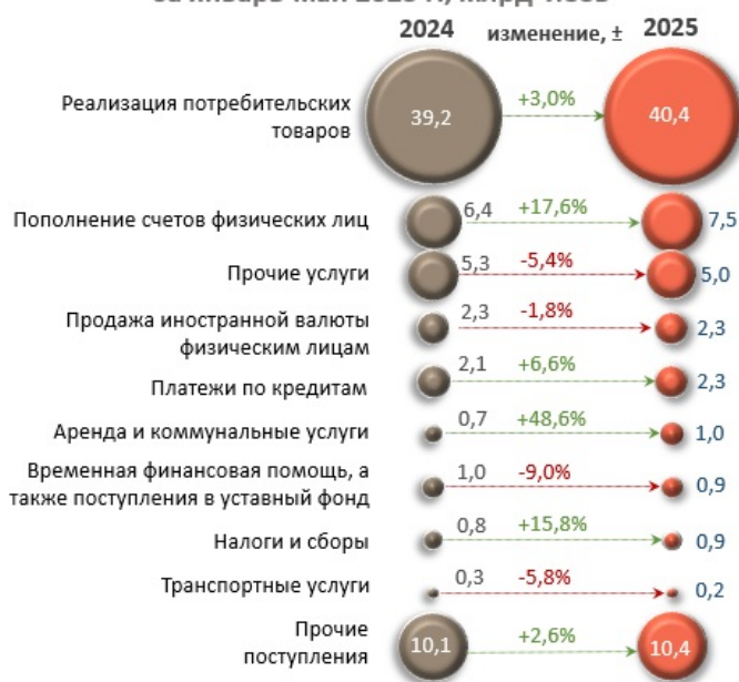
Основные источники денежных поступлений, совокупно за январь-май 2025 г., млрд леев