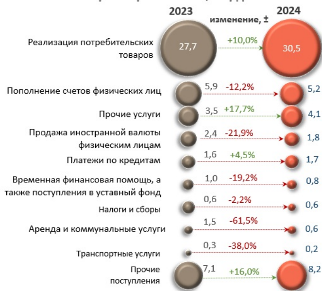
Основные источники денежных поступлений, совокупно за январь - апрель 2024 г., млрд леев