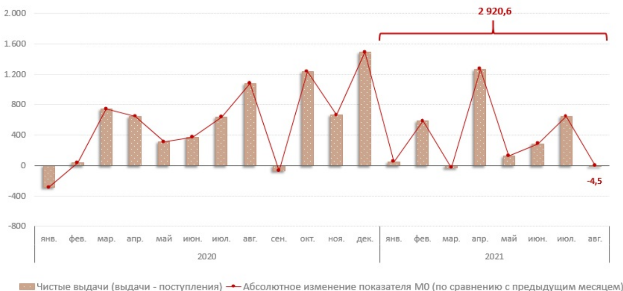
Взаимосвязь показателя M0 с объемом кассовых операций по банковской системе, млн. леев

В январе- августе 2021 г., объем денежных поступлений увеличился на 25,3% по сравнению с аналогичным периодом прошлого года и составил 96 480,1 млн. леев. Увеличение объема денежных поступлений, в основном, обусловлено увеличением на 23,3% поступлений от реализации потребительских товаров (независимо от каналов их реализации), которые имеют наибольшую долю (56,6%) в совокупном объеме поступлений (Диаграмма № 2). Данная эволюция была подкреплена увеличением всех источников денежных поступлений.