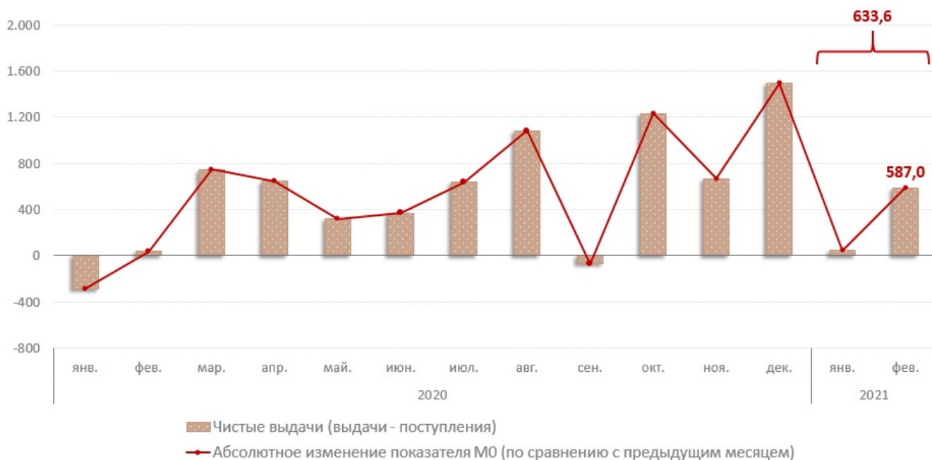
Взаимосвязь показателя M0 с объемом кассовых операций по банковской системе, млн. леев

В январе - феврале 2021 г., объем денежных поступлений снизился на 3,5% по сравнению с аналогичным периодом прошлого года и составил 19 721,3 млн. леев. Снижение объема поступлений наличных денежных средств обусловлено, в основном, снижением на 1,0% поступлений от реализации потребительских товаров (независимо от каналов их реализации), которые имеют наибольшую долю (54,5%) в совокупном объеме поступлений. (Диаграмма № 2). Следует отметить, что данная эволюция была подкреплена сокращением практически всех источников денежных поступлений.