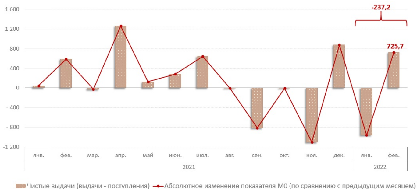
Диаграмма № 1. Взаимосвязь показателя M0 с объемом кассовых операций по банковской системе, млн. леев

В январе - феврале 2022 г., объем денежных поступлений увеличился на 23,2% по сравнению с аналогичным периодом прошлого года и составил 24 288,8 млн. леев. Увеличение объема поступлений наличных денежных средств обусловлено, в основном, увеличением на 14,7% поступлений от реализации потребительских товаров (независимо от каналов их реализации), которые имеют наибольшую долю (50,8%) в совокупном объеме поступлений. (Диаграмма № 2). Следует отметить, что данная эволюция была подкреплена увеличением практически всех источников денежных поступлений.