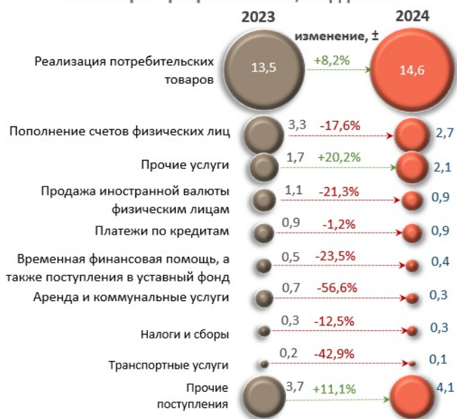
Основные источники денежных поступлений, совокупно за январь - февраль 2024 г., млрд леев