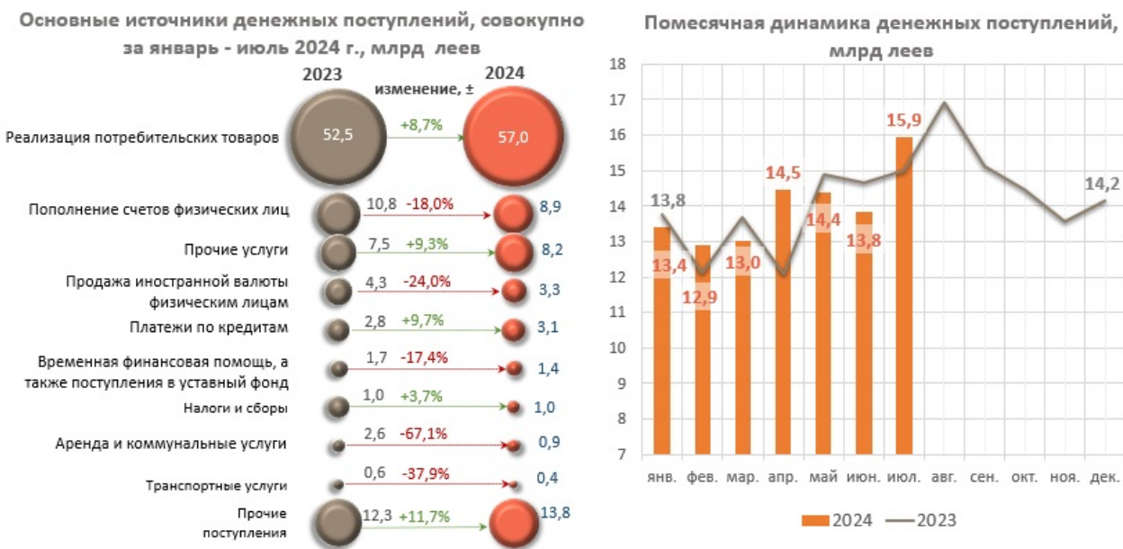
Диаграмма nr. 1. Основные источники поступления денежной наличности в кассах банков и их ежемесячная динамика 4

При этом, в январе – июле 2024 г. значительно сократились поступления наличных денежных средств на текущие и депозитные счета физических лиц на 1 950,8 млн леев (-18,0%), поступления от аренды и коммунальных услуг на 1 745,7 млн леев (-67,1%), а также уменьшилось поступление наличности от продажи иностранной валюты физическим лицам на 1 033,6 млн леев (-24,0%), составив 3 271,7 млн леев (эквивалент 184,2 млн долларов США 3 ).