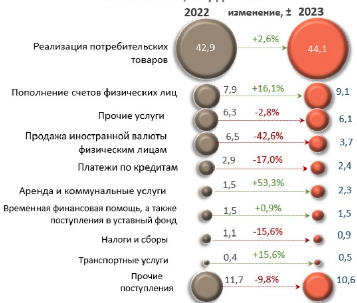
Основные источники денежных поступлений, за январь – июнь 2023 г., млрд леев