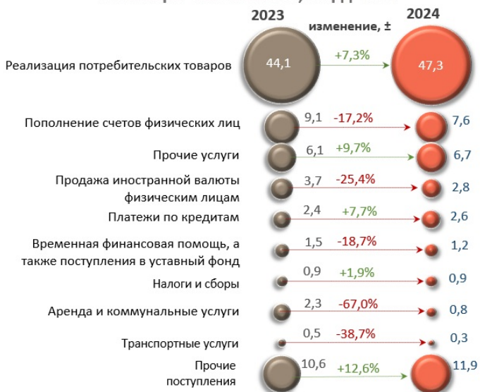
Основные источники денежных поступлений, совокупно за январь - июнь 2024 г., млрд леев