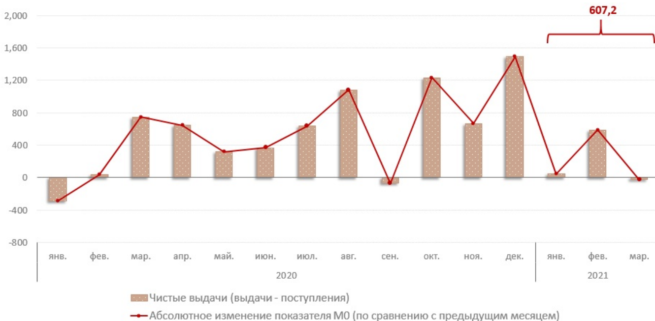
Взаимосвязь показателя M0 с объемом кассовых операций по банковской системе, млн. леев

В январе-марте 2021 г., объем денежных поступлений увеличился на 7,4% по сравнению с аналогичным периодом прошлого года и составил 31 584,0 млн. леев. Увеличение объема денежных поступлений, в основном, обусловлено увеличением на 9,7% поступлений от реализации потребительских товаров (независимо от каналов их реализации), которые имеют наибольшую долю (55,2%) в совокупном объеме поступлений. (Диаграмма № 2). Данная эволюция была подкреплена увеличением практически всех источников денежных поступлений. Вместе с тем, объем поступлений от продажи иностранной валюты физическим лицам снизился на 27,4% (составив долю в 3,1%) по сравнению с аналогичным периодом прошлого года.