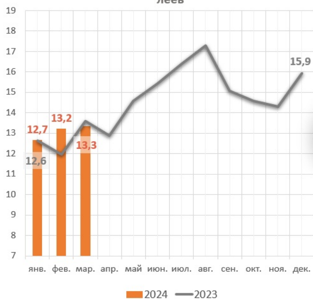
Помесячная динамика выдач денежных средств, млрд леев