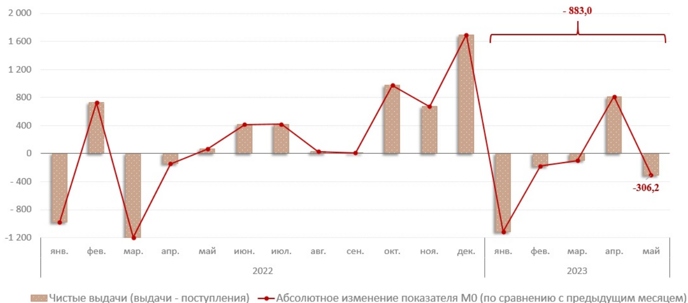
Диаграмма № 1. Взаимосвязь показателя M0 с объемом кассовых операций, млн леев

В мае 2023 г. денежная масса M0^1 (деньги в обращении) составила 33 523,0 млн леев, снизившись на 883,0 млн леев (-2,6%) по сравнению с декабрем 2022 г. (диаграмма №1) в результате снижения в январе - мае 2023 г. объема совокупных выдач над объемом совокупных поступлений в банковскую систему 2 на 882,9 млн леев.