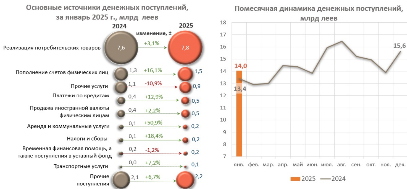
Диаграмма nr. 1. Основные источники поступления денежной наличности в кассах банков и их ежемесячная динамика 3

При этом, значительно сократились поступления от предприятий, предоставляющие другие услуги на 115,8 млн леев (-10,9%).