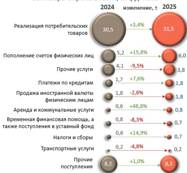
Помесячная динамика денежных поступлений, млрд леев