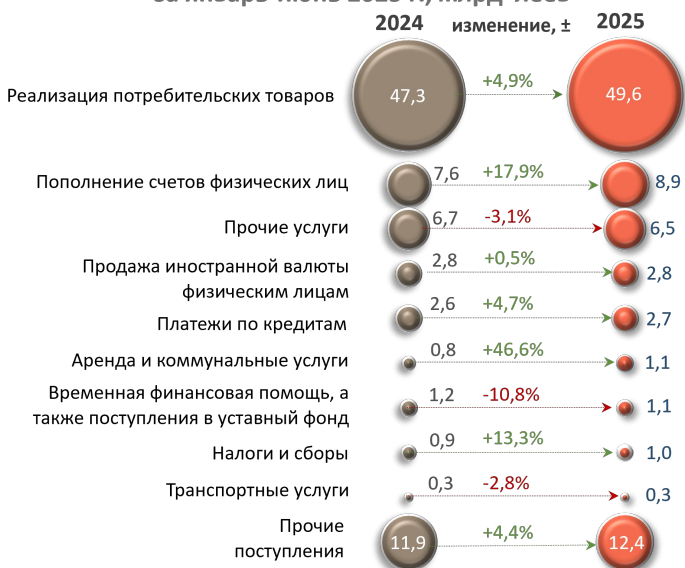
Основные источники денежных поступлений, совокупно за январь-июнь 2025 г., млрд леев