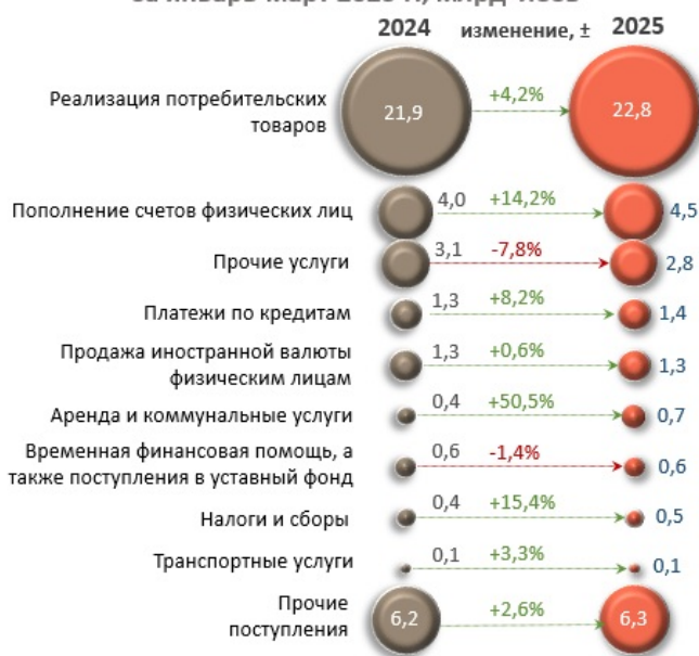
Основные источники денежных поступлений, совокупно за январь-март 2025 г., млрд леев