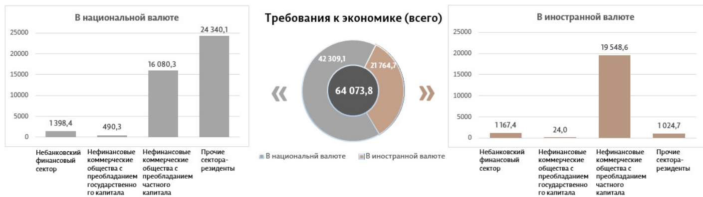
Диаграмма 4. Объем требований к экономике в апреле 2023 10 , миллионы леев