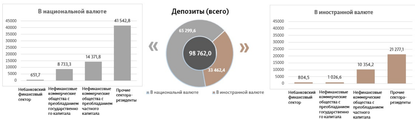
Диаграмма 3. Объем депозитов в апреле 2023 7 , миллионы леев

Сальдо депозитов в национальной валюте увеличилось на 1 904,8 миллиона леев по сравнению с предыдущим месяцем и составило 65 299,6 миллиона леев, составив долю 66,1% от общего сальдо депозитов. В то же время сальдо депозитов в иностранной валюте (пересчитанное в леях) снизилось на 214,3 миллиона леев по сравнению с предыдущим месяцем, до уровня 33 462,4 миллиона леев, с долей 33,9% (диаграмма 3).