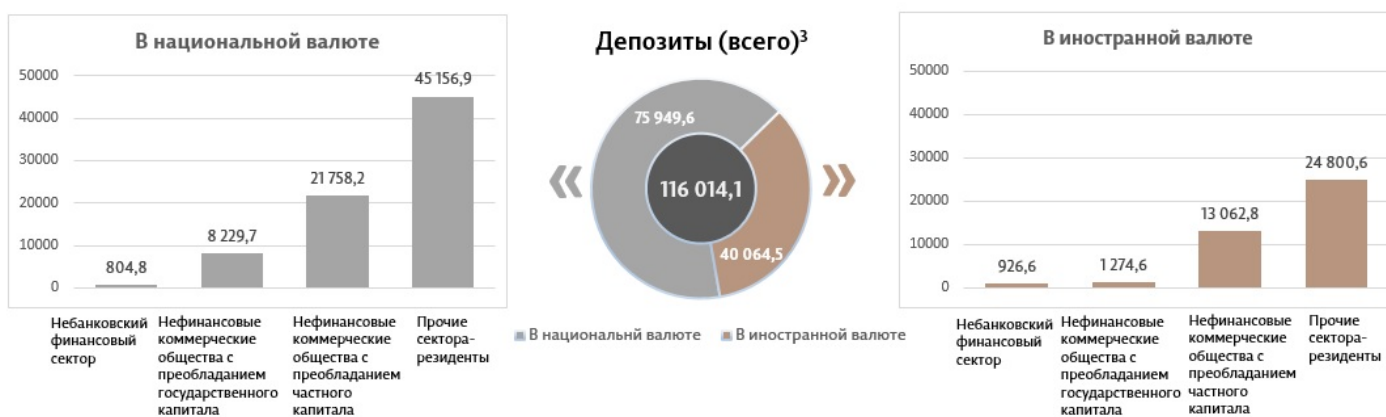
Диаграмма 3. Объем депозитов в апреле 2024 г. 7 , миллионы леев

Сальдо депозитов в национальной валюте увеличилось на 1 420,0 миллиона леев по сравнению с предыдущим месяцем и составило 75 949,6 миллиона леев, составив долю 65,5% от общего сальдо депозитов. В то же время сальдо депозитов в иностранной валюте (пересчитанное в леях) увеличилось на 205,6 миллиона леев по сравнению с предыдущим месяцем, до уровня 40 064,5 миллиона леев, с долей 34,5% (диаграмма 3).