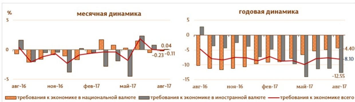
Диаграмма 3. Динамика требований к экономике

Следует отметить, что требования к экономике в иностранной валюте, выраженные в долларах США, увеличились в течении отчетного периода на 12.9 млн. USD.