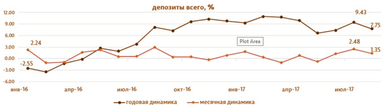
Диаграмма 2. Динамика депозитов Структура депозитов группируется по институциональным секторам в соответствии с Инструкцией о порядке составления и предоставления банками отчета по денежной статистике (Monitorul Oficial al Republicii Moldova nr. 206-215 din 2 decembrie 2011) [1]

Сальдо депозитов в национальной валюте снизилось на 344.8 млн. леев и составило 31049.3 млн. леев, составив долю 54.9% от общего сальдо депозитов, а сальдо депозитов в иностранной валюте (пересчитанное в леях) выросло на 1098.0 млн. леев, до уровня 25507.3 млн. леев, с долей 45.1% (диаграмма 2).