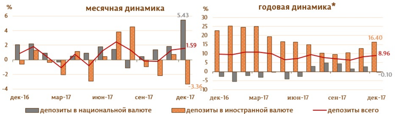
Диаграмма 2. Динамика депозитов Структура депозитов группируется по институциональным секторам в соответствии с Инструкцией о порядке составления и предоставления банками отчета по денежной статистике (Monitorul Oficial al Republicii Moldova nr. 206-215 din 2 decembrie 2011) [1]

Сальдо депозитов в национальной валюте увеличилось на 1746.4 млн. леев и составило 33936.7 млн. леев, с долей 58.5% от общего сальдо депозитов, а сальдо депозитов в иностранной валюте (пересчитанное в молдавских леев) снизилось на 836.1 млн. леев, до уровня 24066.6 млн. леев, с долей 41.5% (диаграмма № 2).