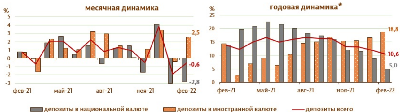
Диаграмма 2. Динамика депозитов 7 , %