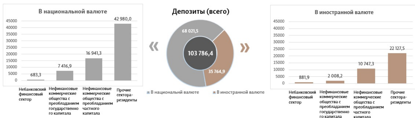
Диаграмма 3. Объем депозитов 7 в июне 2023 г., миллионы леев

Сальдо депозитов в национальной валюте увеличилось на 440,7 миллиона леев по сравнению с предыдущим месяцем и составило 68 021,5 миллиона леев, составив долю 65,5% от общего сальдо депозитов. В то же время сальдо депозитов в иностранной валюте (пересчитанное в леях) увеличилось на 2 081,5 миллиона леев по сравнению с предыдущим месяцем, до уровня 35 764,9 миллиона леев, с долей 34,5% (диаграмма 3).