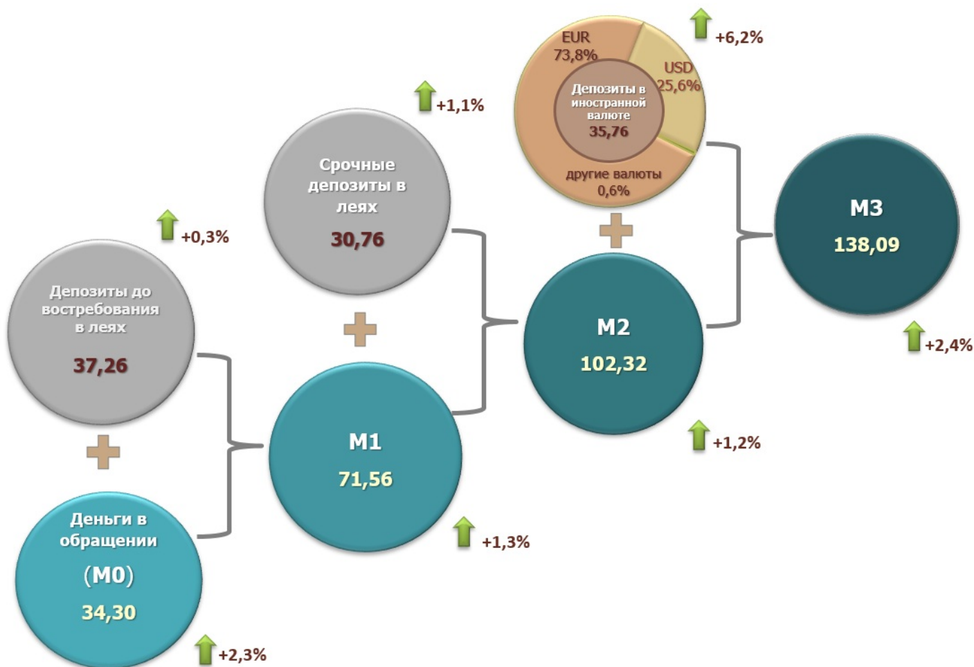
Диаграмма 1. Динамика денежной массы в июне 2023 г. по сравнению с предыдущим месяцем, миллиарды леев 3

Денежная масса M0 2 (Деньги в обращении) увеличилась на 780,1 миллиона леев или на 2,3% по сравнению с маем 2023 г. и составила 34 303,1 миллиона леев, что на 12,1% больше, чем в аналогичном периоде прошлого года (диаграмма 1).