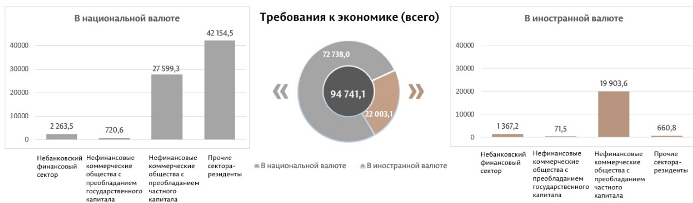
Диаграмма 4. Объём требований к экономике в июне 2025 10 г., миллионы леев