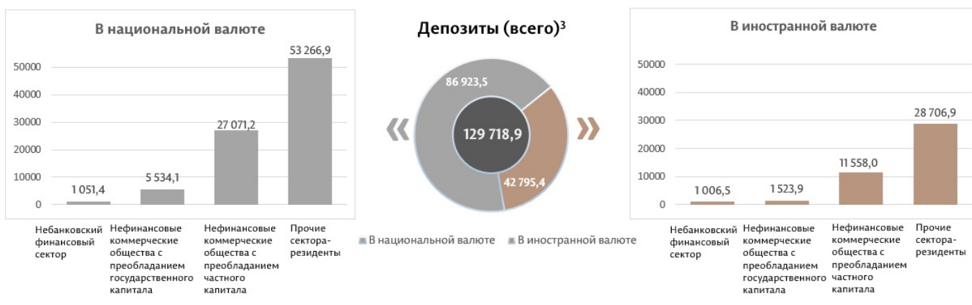
Диаграмма 3. Сальдо депозитов в июне 2025 7 г., миллионы леев

Сальдо депозитов в национальной валюте увеличилось на 615,8 миллиона леев по сравнению с предыдущим месяцем, составив 86 923,5 миллиона леев или 67,0% от общего сальдо депозитов. В то же время сальдо депозитов в иностранной валюте (пересчитанное в леи) увеличилось по сравнению с предыдущим месяцем на 452,2 миллиона леев до уровня 42 795,4 миллиона леев или 33,0% от общего сальдо депозитов (диаграмма 3).