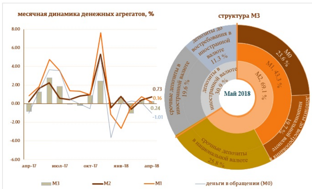
Диаграмма 1. Денежный агрегат M3

Следует отметить, что денежные агрегаты Деньги в обращении (M0) и Денежная масса (M1) Денежная масса M1 включает деньги в обращении и депозиты резидентов до востребования в молдавских леях. выросли по отношению к маю 2017 года на 9.5 и на 19.5%, соответственно.