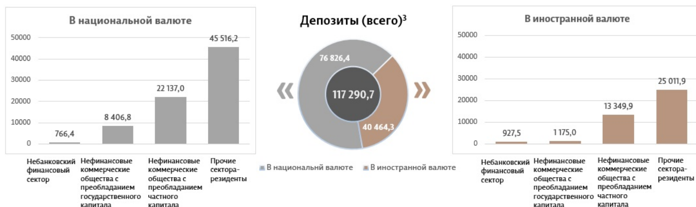
Диаграмма 3. Объем депозитов в мае 2024 г. 7 , миллионы леев

Сальдо депозитов в национальной валюте увеличилось на 876,8 миллиона леев по сравнению с предыдущим месяцем до уровня в 76 826,4 миллиона леев, составив 65,5% от общего сальдо депозитов. В то же время сальдо депозитов в иностранной валюте (пересчитанное в леях) увеличилось на 399,9 миллиона леев по сравнению с предыдущим месяцем, до уровня 40 464,3 миллиона леев, с долей 34,5% (диаграмма 3).