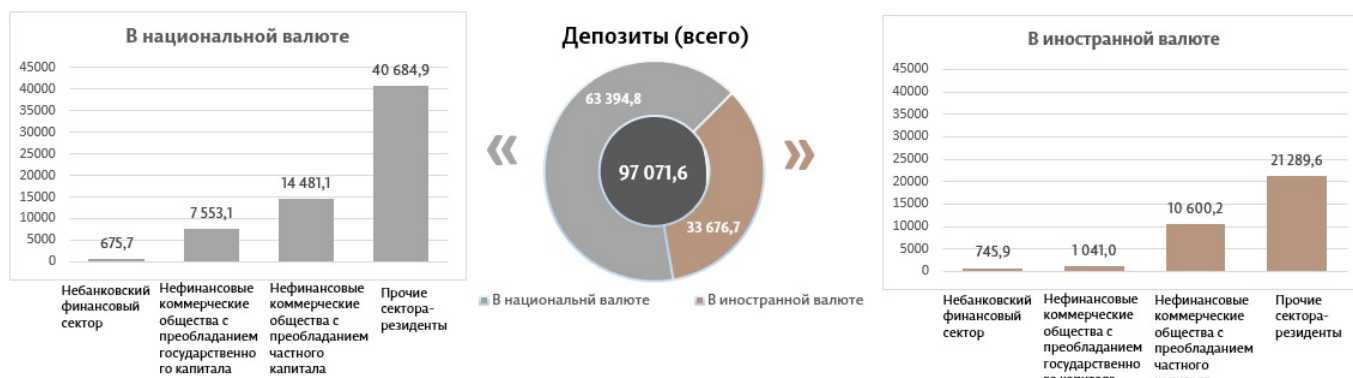
Диаграмма 3. Объем депозитов в марте 2023 7 , миллионы леев

Сальдо депозитов в национальной валюте увеличилось на 2 429,5 миллиона леев по сравнению с предыдущим месяцем и составило 63 394,8 миллиона леев, составив долю 65,3% от общего сальдо депозитов. В то же время сальдо депозитов в иностранной валюте (пересчитанное в леях) снизилось на 373,9 миллиона леев по сравнению с предыдущим месяцем, до уровня 33 676,7 миллиона леев, с долей 34,7% (диаграмма 3).