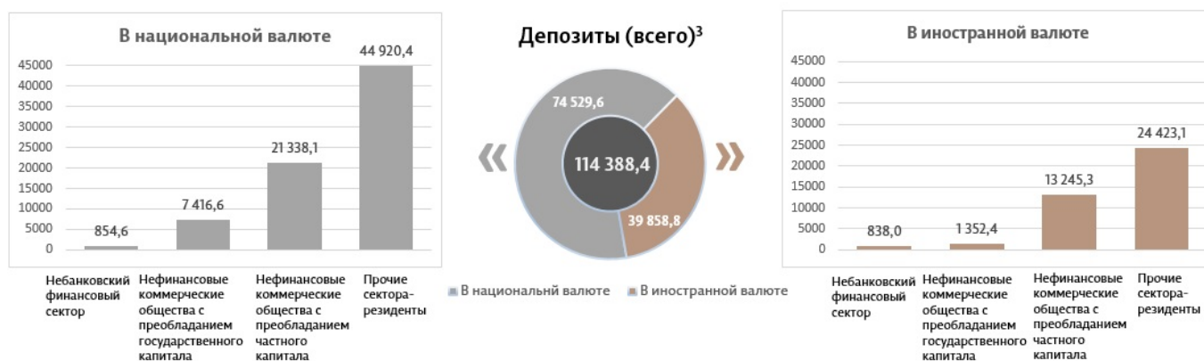
Диаграмма 3. Объем депозитов в марте 2024 7 г., миллионы леев

Сальдо депозитов в национальной валюте увеличилось на 270,1 миллиона леев по сравнению с предыдущим месяцем и составило 74 529,6 миллиона леев, составив долю 65,2% от общего сальдо депозитов. В то же время сальдо депозитов в иностранной валюте (пересчитанное в леях) увеличилось на 54,7 миллиона леев по сравнению с предыдущим месяцем, до уровня 39 858,8 миллиона леев, с долей 34,8% (диаграмма 3).