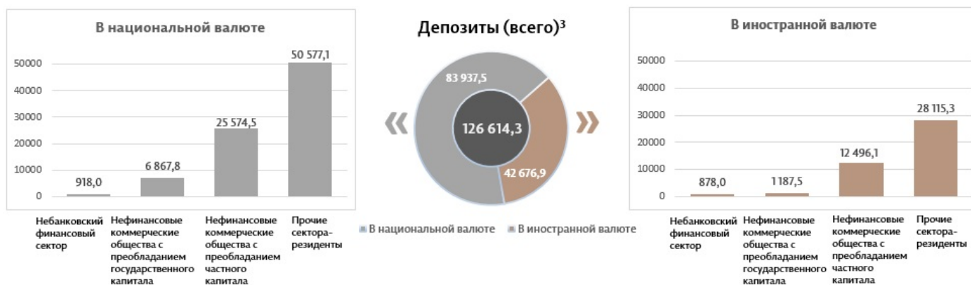
Диаграмма 3. Объём депозитов в марте 2025 7 г., миллионы леев

Сальдо депозитов в национальной валюте уменьшилось на 445,6 миллиона леев по сравнению с предыдущим месяцем, составив 83 937,5 миллиона леев, или 66,3% от общего сальдо депозитов. В то же время сальдо депозитов в иностранной валюте (пересчитанное в лях) уменьшилось на 591,6 миллиона леев по сравнению с предыдущим месяцем, до уровня 42 676,9 миллиона леев, с долей 33,7% (диаграмма 3).