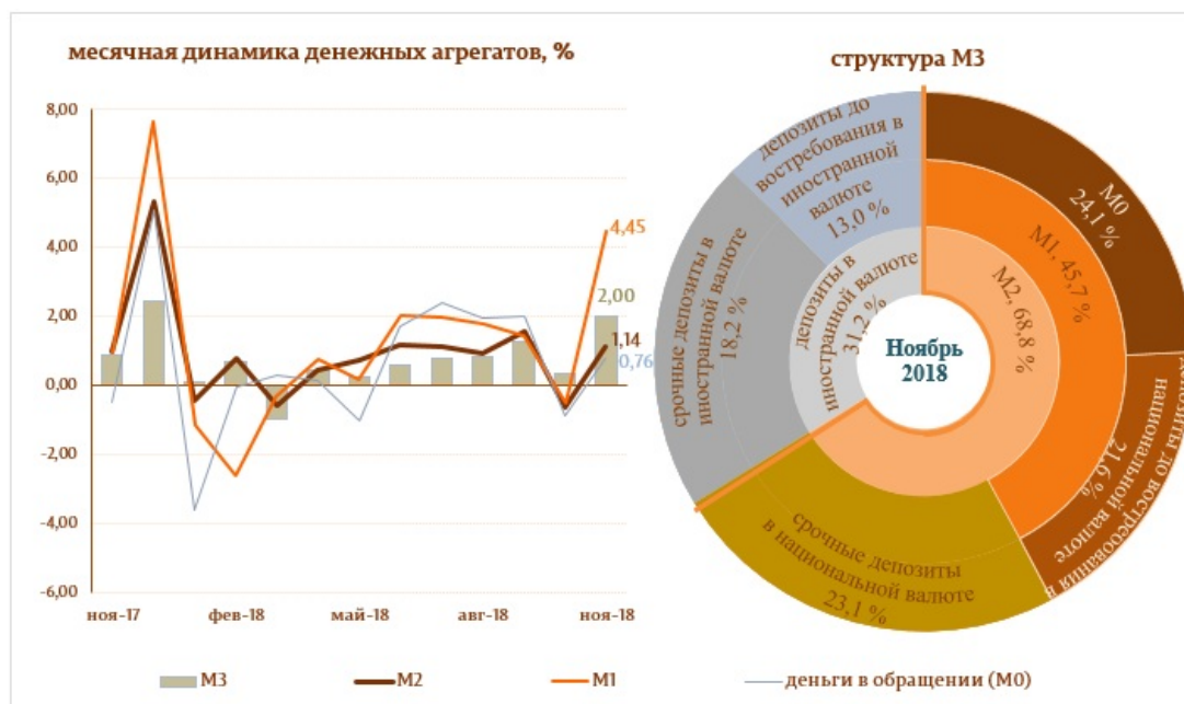
Диаграмма 1. Денежный агрегат M3

Следует отметить, что денежные агрегаты Деньги в обращении (M0) и Денежная масса (M1) 5 выросли по отношению к ноябрю 2017 года на 8,9 и 16,3%, соответственно.