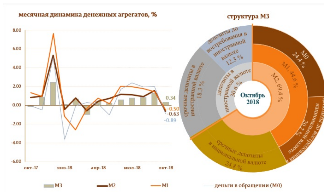
Диаграмма 1. Денежный агрегат M3

Следует отметить, что денежные агрегаты Деньги в обращении (M0) и Денежная масса (M1) 5 выросли по отношению к октябрю 2017 года на 7.5 и на 12.5%, соответственно.