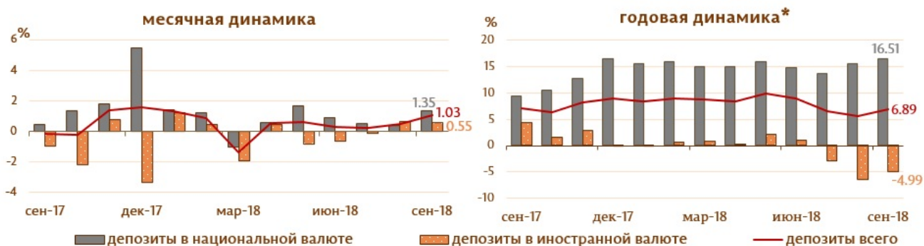
Диаграмма 2. Динамика депозитов 6 Структура депозитов группируется по институциональным секторам в соответствии с Инструкцией о порядке составления и предоставления банками отчета по денежной статистике (Monitorul Oficial al Republicii Moldova nr. 206-215 din 2 decembrie 2011) [1]