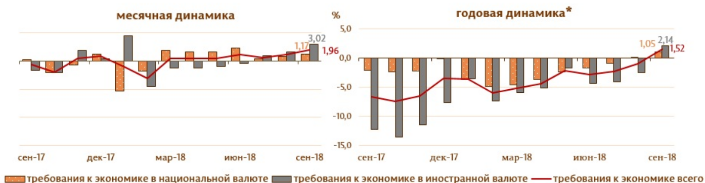
Диаграмма 3. Динамика требований к экономике

Сальдо требований к экономике 9 выросло в отчетном периоде на 748.3 млн. леев (2.0%) за счет увеличения требований к экономике в национальной валюте на 257.2 млн. леев (1.2%), а также требований в иностранной валюте (выраженных в молдавских леях) на 491.1 млн. леев или на 3.0% (диаграмма 3).