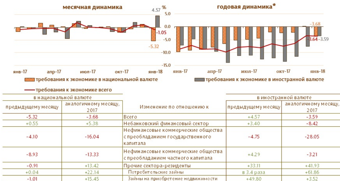
Диаграмма 3. Динамика требований к экономике

Динамика сальдо требований к экономике в национальной валюте была определена снижением требований к нефинансовым коммерческим обществам с преобладанием государственного капитала, сальдо требований к нефинансовым коммерческим обществам с преобладанием частного капитала и сальдо требований к другим секторам резидентам (в том числе физическим лицам) на 35.6 млн. леев (4.1%), на 1045.0 млн. леев (8.9%) и на 75.7 млн. леев (0.9%), соответственно. В то же время, сальдо требований к небанковскому финансовому сектору выросло на 4.1 млн. леев (0.6%).