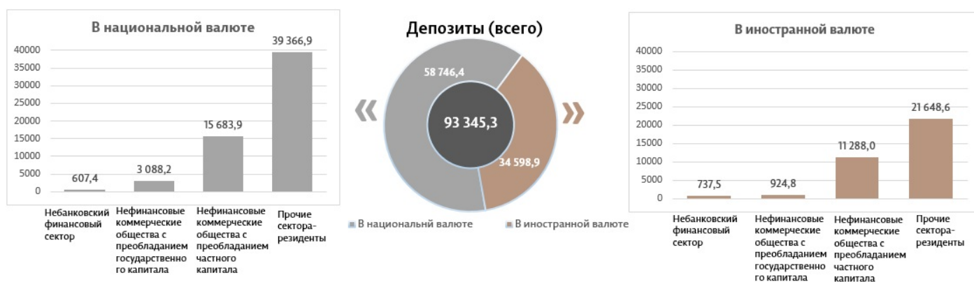
Диаграмма 3. Объем депозитов в январе 2023 7 , млн леев

Сальдо требований к экономике 8 (диаграмма 4) составило 63 240,6 миллиона леев, снизившись в январе 2023 по сравнению с декабрем 2022 на 1 000,1 миллиона леев (1,6%), за счет снижения требований к экономике в национальной валюте на 827,6 миллиона леев (2,0%). В то же время требования к экономике в валюте (пересчитанные в леях) снизились на 172,4 миллиона леев (0,8%).