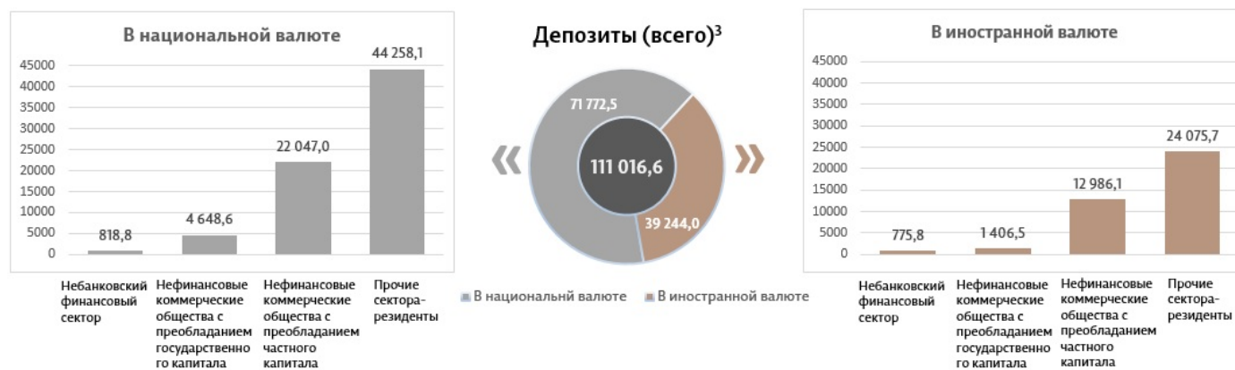
Диаграмма 3. Объем депозитов в январе 2024 г. 7 , миллионы леев

Сальдо депозитов в национальной валюте увеличилось на 294,3 миллиона леев по сравнению с предыдущим месяцем и составило 71 772,5 миллиона леев, составив долю 64,7% от общего сальдо депозитов. В то же время сальдо депозитов в иностранной валюте (пересчитанное в леях) увеличилось на 95,6 миллиона леев по сравнению с предыдущим месяцем, до уровня 39 244,0 миллиона леев, с долей 35,3% (диаграмма 3).