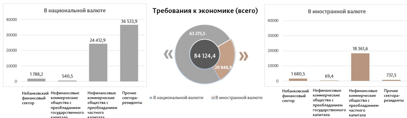
Диаграмма 4. Объём требований к экономике в январе 2025 г. 10 , миллионы леев

074,0 миллиона EUR, увеличившись на 12,5 миллиона EUR (+1,2%) по сравнению с декабрём 2024 г.