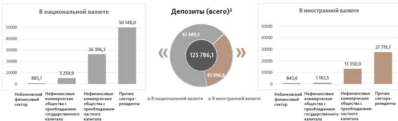
Диаграмма 3. Объём депозитов в январе 2025 г. 7 , миллионы леев

Сальдо депозитов в национальной валюте увеличилось на 681,2 миллиона леев по сравнению с предыдущим месяцем, составив 82 689,3 миллиона леев, или 65,7% от общего сальдо депозитов. В то же время сальдо депозитов в иностранной валюте (пересчитанное в леях) уменьшилось на 388,9 миллиона леев по сравнению с предыдущим месяцем, до уровня 43 096,8 миллиона леев, с долей 34,3% (диаграмма 3).