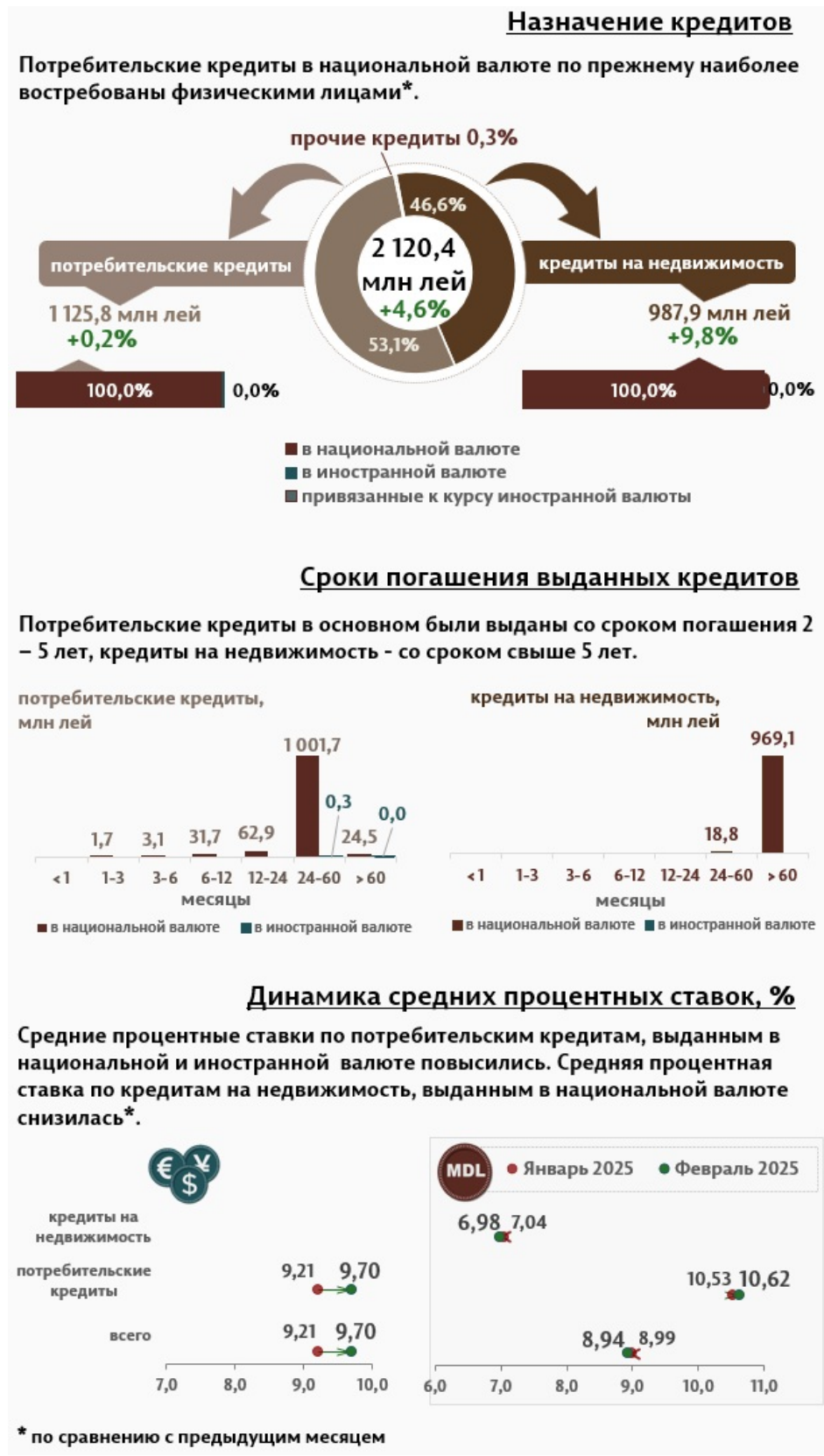
Инфографика 2. Вновь выданные кредиты физическим лицам

Кредиты на недвижимость были представлены только в национальной валюте и составляют 46,6% от общего объёма кредитов, выданных физическим лицам.