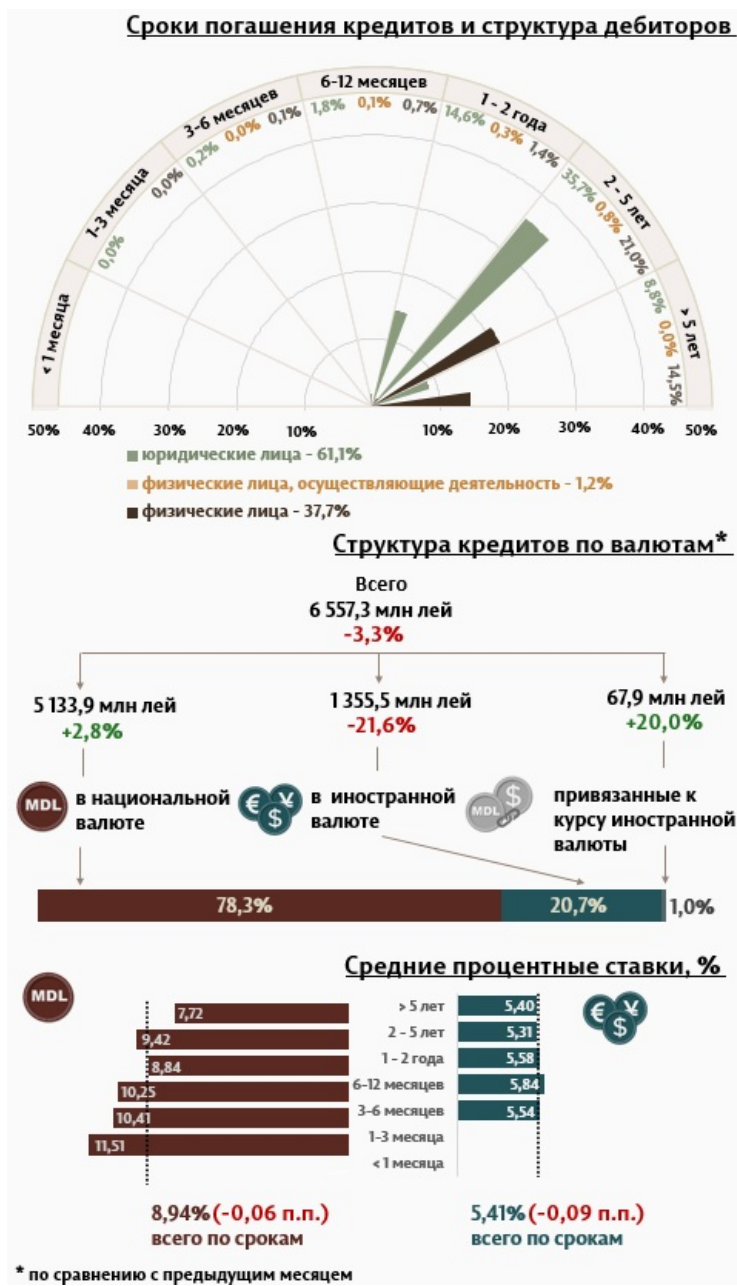
Инфографика 1. Динамика вновь выданных кредитов

В разрезе сроков выданных кредитов, наибольшим спросом пользовались кредиты со сроком от 2 до 5 лет, доля которых составила 57,5% от общего объема выданных кредитов. Объем данных кредитов, выданных юридическим лицам, составил 35,7% от общего объема кредитов.