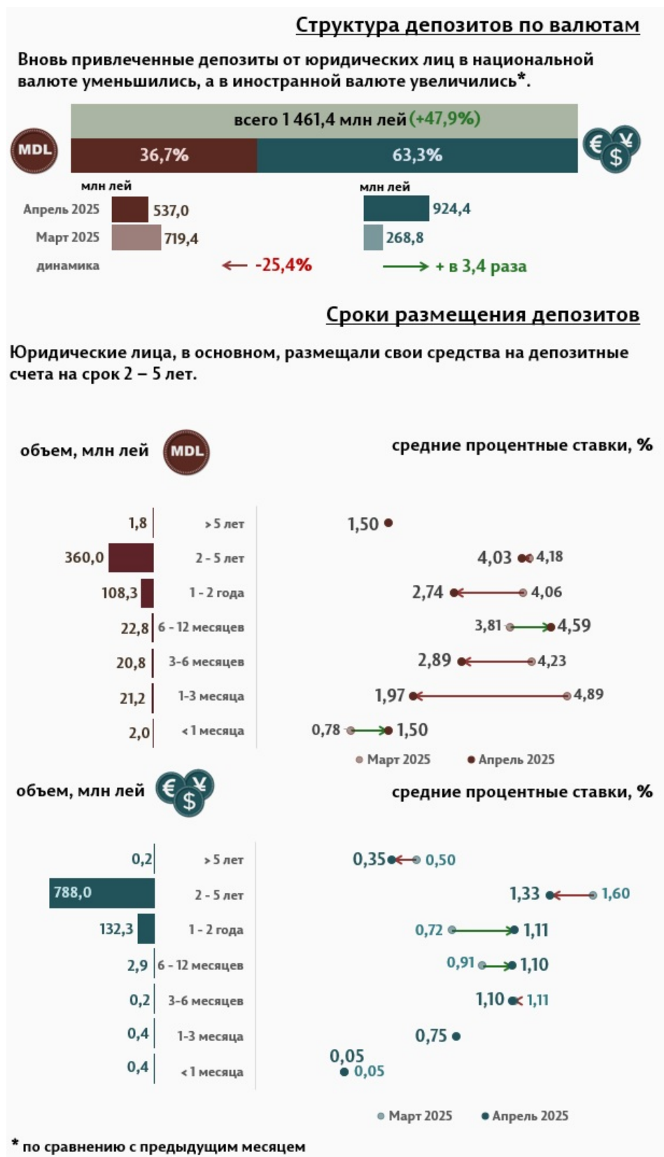
Инфографика 3. Вновь привлечённые срочные депозиты от юридических лиц

Средняя ставка по депозитам, привлечённым в национальной валюте от юридических лиц, по сравнению с предыдущим месяцем снизилась на 0,50 п.п., до уровня 3,65%, а средняя ставка по депозитам, привлечённым в