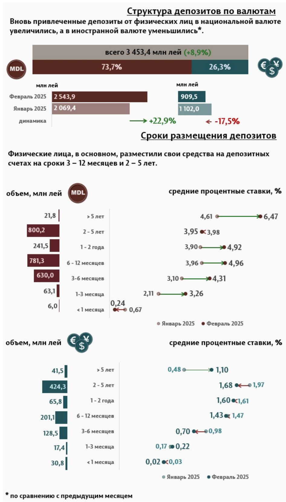
Инфографика 2. Вновь привлечённые срочные депозиты от физических лиц

Средняя процентная ставка по депозитам, привлечённым в национальной валюте от физических лиц, по сравнению с предыдущим месяцем повысилась на 0,71 п.п., до уровня 4,44%. Средняя процентная ставка по депозитам, привлечённым в иностранной валюте, снизилась на 0,11 п.п. и составила 1,37%