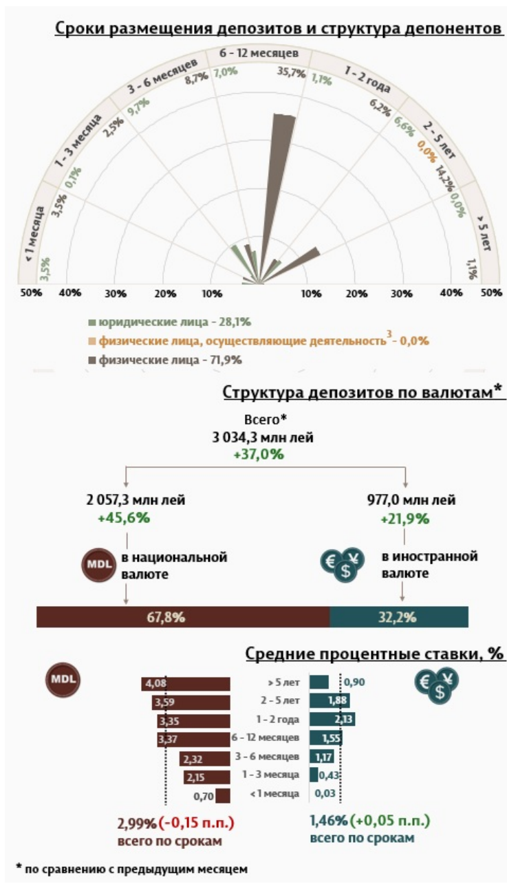
Инфографика 1. Динамика вновь привлечённых депозитов 2

В июле 2024 г. вновь привлечённые срочные депозиты 1 (Инфографика 1) составили 3 034,3 миллиона леев, увеличившись на 37,0% по сравнению с июнем 2024 года. Привлечённые депозиты в национальной валюте составили наибольшую долю в 67,8% или 2 057,3 миллиона леев, что на 45,6% больше по сравнению с предыдущим месяцем. Депозиты, привлечённые в иностранной валюте, составили 977,0 миллиона леев, увеличившись на 21,9 процента по сравнению с предыдущим месяцем.