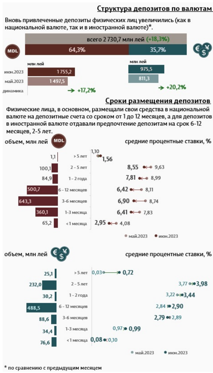
Инфографика 2. Вновь привлеченные срочные депозиты от физических лиц

Депозиты физических лиц в июне 2023 года составили 2 730,7 миллиона леев, на 18,3% выше по сравнению с предыдущим месяцем (Инфографика 2).