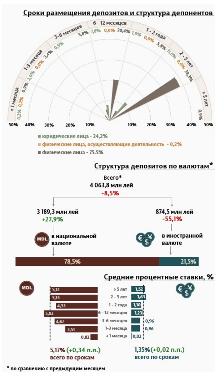
Инфографика 1. Динамика вновь привлечённых депозитов

В мае 2025 г. вновь привлечённые срочные депозиты 1 (Инфографика 1) составили 4 063,8 миллиона леев, уменьшившись на 8,5% по сравнению с апрелем 2025 года. Привлечённые депозиты в национальной валюте составили наибольшую долю в 78,5% или 3 189,3 миллиона леев, что на 27,9% больше по сравнению с предыдущим месяцем. Депозиты, привлечённые в иностранной валюте, составили 874,5 миллиона леев, уменьшившись на 55,1% по сравнению с предыдущим месяцем.