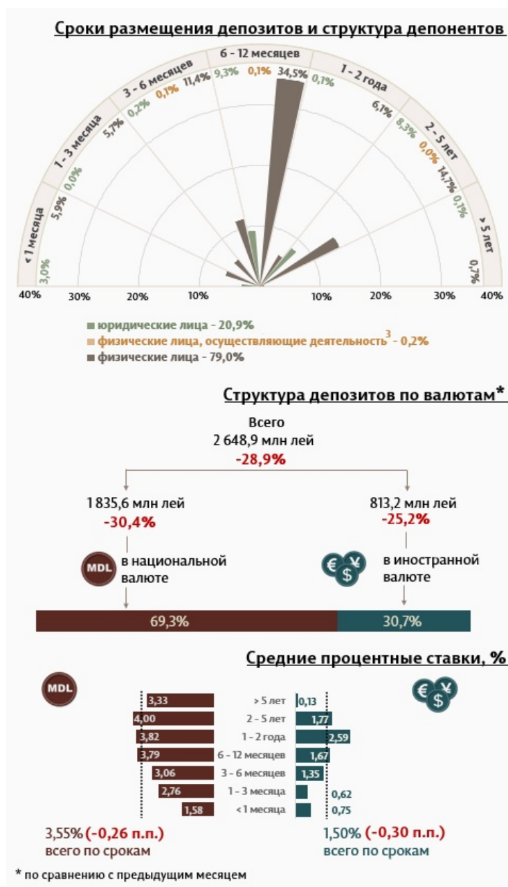
Инфографика 1. Динамика вновь привлеченных депозитов 2

В марте 2024 г. вновь привлеченные срочные депозиты 1 (Инфографика 1) составили 2 648,9 миллиона леев, на 28,9% ниже февраля 2024 года. Привлеченные депозиты в национальной валюте составили наибольшую долю в 69,3% или 1 835,6 миллиона леев, что на 30,4% ниже по сравнению с предыдущим месяцем. Депозиты, привлеченные в иностранной валюте, составили 813,2 млн леев, снизившись на 25,2% по сравнению с предыдущим месяцем.