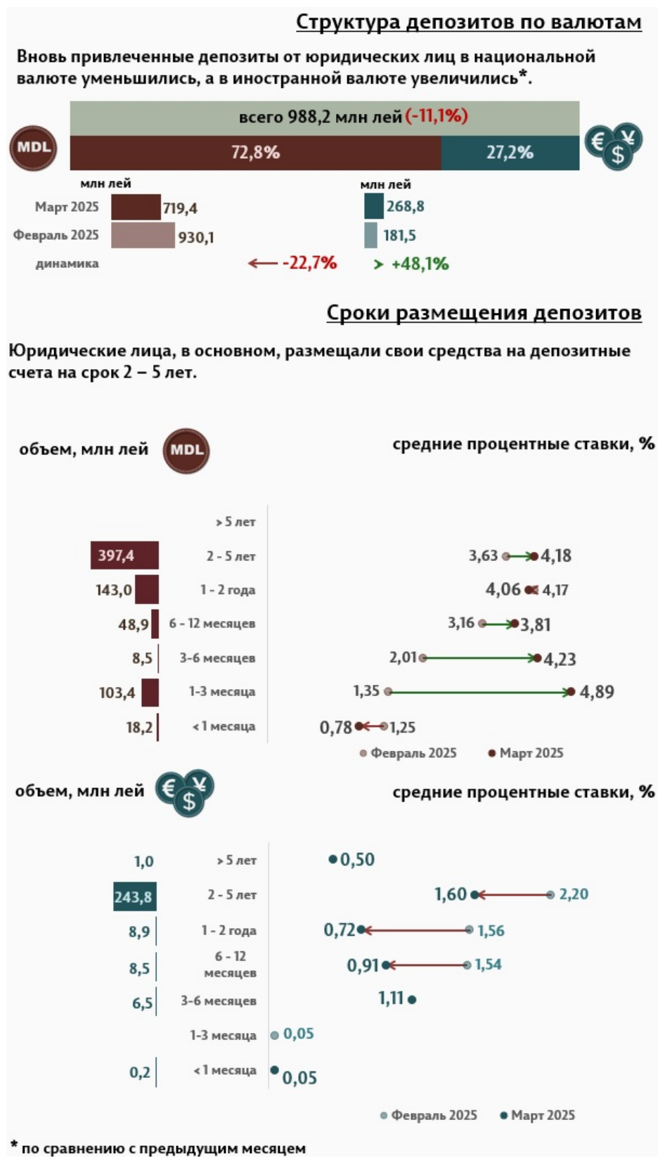
Инфографика 3. Вновь привлечённые срочные депозиты от юридических лиц

В марте 2025 г., по сравнению с предыдущим месяцем, объём депозитов юридических лиц в национальной валюте сократился на 22,7%, а в иностранной валюте увеличился на 48,1% (Инфографика 3). Депозиты юридических лиц в национальной валюте составили 719,4 миллиона леев, а в иностранной валюте – 268,8 миллиона леев. По сравнению с мартом 2024 г., объём депозитов юридических лиц в национальной валюте увеличился на 59,8%, а в иностранной валюте увеличился в 2,6 раза.