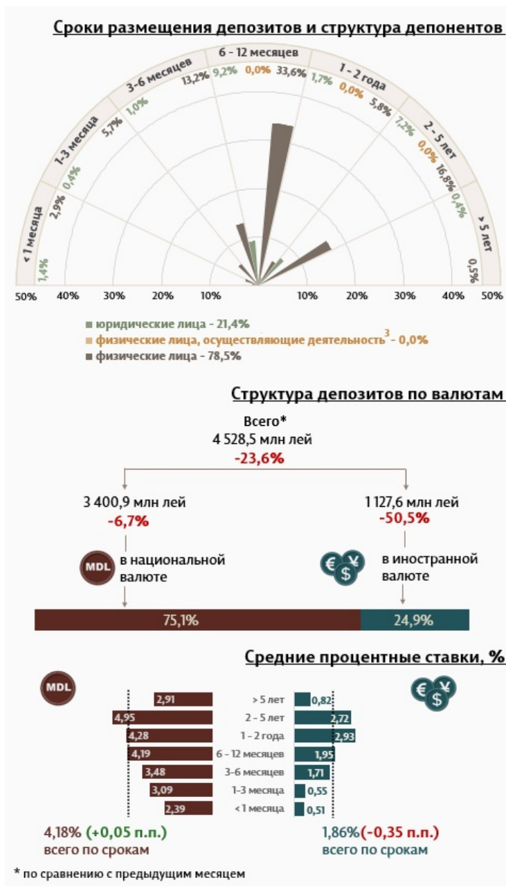
Инфографика 1. Динамика вновь привлеченных депозитов 2

В январе 2024 г. вновь привлеченные срочные депозиты 1 (Инфографика 1) составили 4 528,5 миллиона леев, на 23,6% ниже декабря 2023 года. Привлеченные депозиты в национальной валюте составили наибольшую долю в 75,1% или 3 400,9 миллиона леев, что на 6,7% ниже по сравнению с предыдущим месяцем. Депозиты, привлеченные в иностранной валюте, составили 1 127,6 млн леев, снизившись на 50,5% по сравнению с предыдущим месяцем.